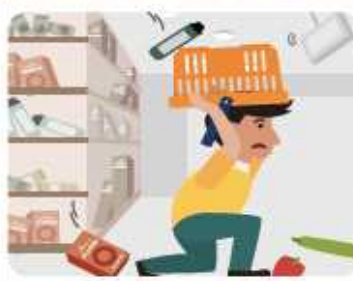
백화점, 마트에 있을 경우

진열장에서 떨어지는 물건으로부터 몸을 보호하고, 계단이나 기둥 근처로 가 있습니다. 흔들림이 멈추면 밖으로 대피합니다.