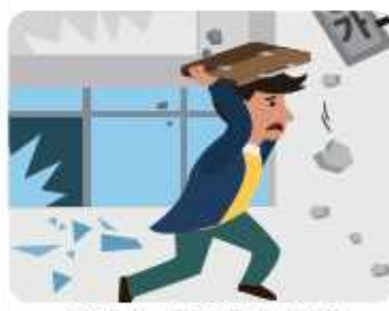
집밖에 있을 경우

떨어지는 물건에 대비하여 가방이나 손으로 머리를 보호하며, 건물과 거리를 두고 운동장이나 공원 등 넓은 공간으로 대피합니다.