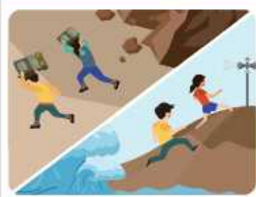
산이나 바다에 있을 경우

산사태, 절벽 붕괴에 주의하고 안전한 곳으로 대피합니다. 해안에서 지진해일 특보가 발령되면 높은 곳으로 이동합니다.