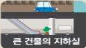
큰 건물의 지하실