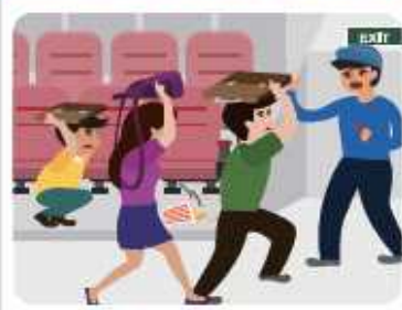
극장, 경기장 등에 있을 경우

흔들림이 멈출 때까지 가방 등 소지품으로 몸을 보호하면서 자리에 있다가, 안내에 따라 침착하게 대피합니다.