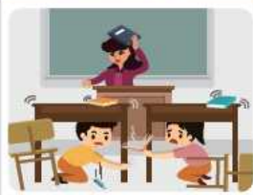
학교에 있을 경우

책상 아래로 들어가 책상 다리를 꼭 잡습니다. 흔들림이 멈추면 질서를 지키며 운동장으로 대피합니다.