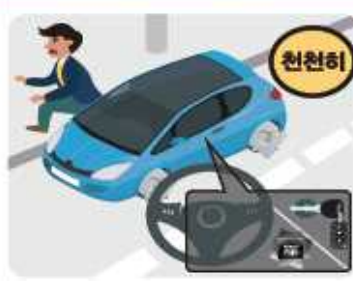
운전을 하고 있을 경우

비상등을 켜고 서서히 속도를 줄여 도로 오른쪽에 차를 세우고, 라디오의 정보를 잘 들으면서 키를 꽂아 두고 대피합니다.