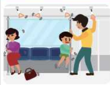
전철을 타고 있을 경우

손잡이나 기둥을 잡아 넘어지지 않도록 합니다. 전철이 멈추면 안내에 따라 행동합니다.