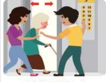
엘리베이터에 있을 경우

모든 층의 버튼을 눌러 가장 먼저 열리는 층에서 내린 후 계단을 이용합니다. ※ 지진 시 엘리베이터를 타면 안됩니다.